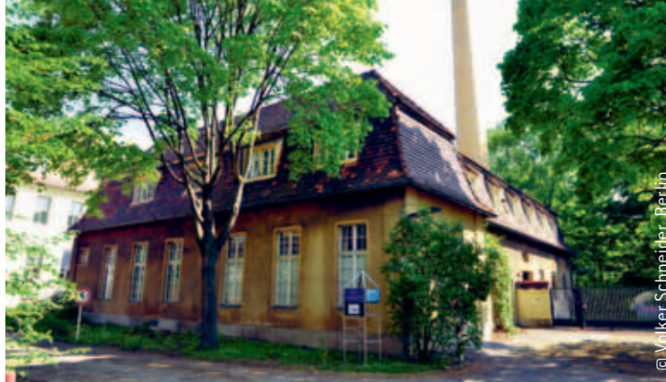
Ehemaliges Maschinenhaus, zukünftiges Haus für Außenseiterkunst in Berlin